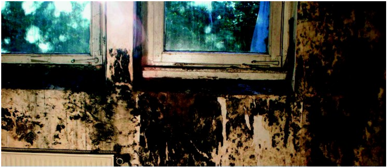
Eine verschimmelte Tapete muss entfernt werden.